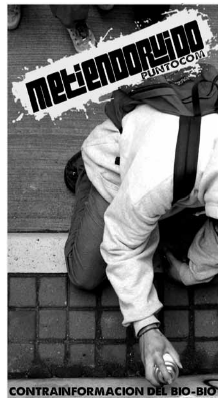
CONTRAINFORMACION DEL BIO-BIO

Andes). Mediante hostigamientos constantes como grabaciones durante días, abordajes a los “antisociales” en busca de respuestas y confesiones ante el ilícito, para el canal flagrante, los periodistas buscan -y logran- recibir agresiones que vendrían a mostrar “el verdadero rostro” del centro social en cuestión. La clara y -a nuestro juicio- más que justificada hostilidad hacia la prensa es utilizada en función del dramatismo que significa una agresión a la prensa, que por extensión sería un atentado a la libertad y a la democracia, los valores que ellos dicen defender, representar y difundir. La conclusión es clara: falta seguridad, más rejas, más pacos y lo que pasa en el reportaje puede pasarle también a usted.