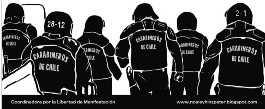
Coordinadora por la Libertad de Manifestación

Convierte en delito la ocupación de cualquier establecimiento privado o público como liceos, colegios o universidades.